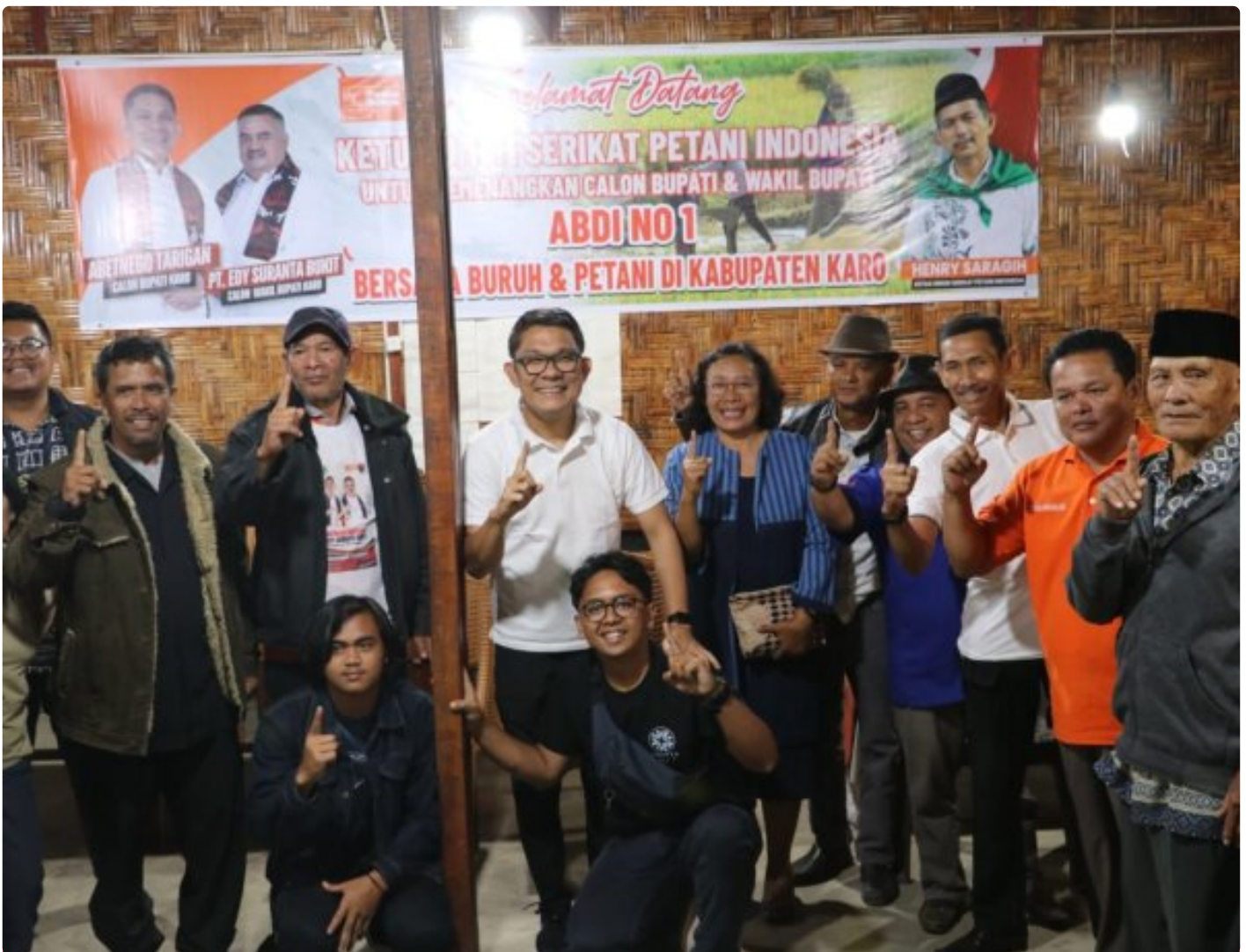
Ketum DPP Serikat Petani Indonesia (SPI) dan Buruh Konsolidasi Dukung Abetnego - Edy, Sabtu (02/11-2024)

KARO - Tak henti-hentinya support untuk memenangkan pasangan calon